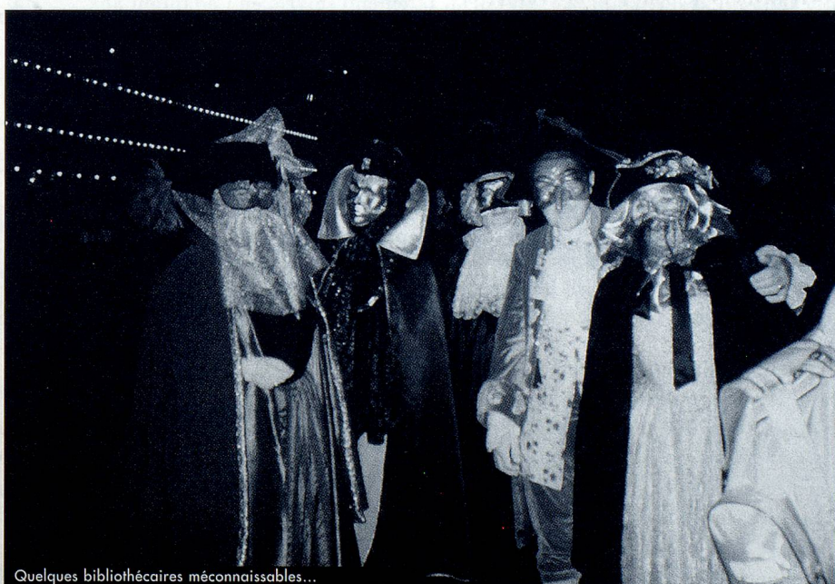
Quelques bibliothécaires méconnaissables...