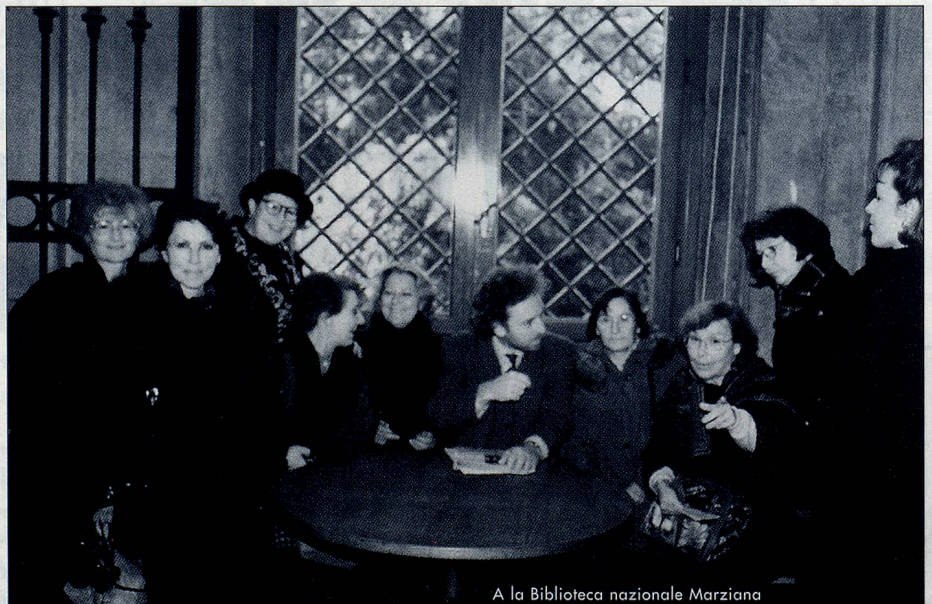
A la Biblioteca nazionale Marziana

La visite d'une autre demeure patriecienne, la Casa Rezzonico, a dû être