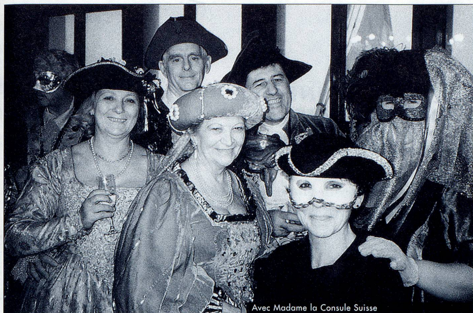
Avec Madame la Consule Suisse

restreinte aux salles du rez-de-chaussée, les autres étages étant en rénovation (comme beaucoup d'autres bâtisses dans cette ville fragilisée par son environnement). En fait, la direction avait omis de nous le signaler lors de notre réservation; ce fut donc une visite écourtée mais néanmoins impressionnante: à l'entrée les esquisses de Tiepolo évoquant le Carnaval au 18 e siècle nous ont enchantés; de très belles peintures de Guardi et d'autres célèbres peintres vénitiens nous ont donné une idée de la richesse de cette collection exceptionnelle.