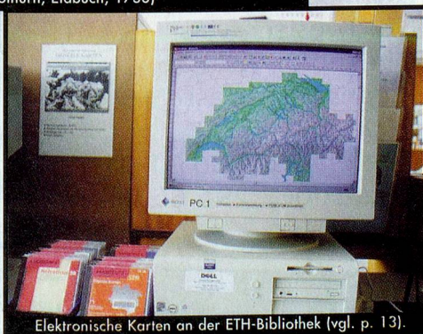
Elektronische Karten an der ETH-Bibliothek (vgl. p. 13).

Die publikumsorientierte, benutzungsfreundliche, themenadäquate Informationsvermittlung beginnt schon beim öffentlichen Zugang zu Archiven, Bibliotheken und Dokumentationsstellen. (Illustration: BulliART - nach einem Original von Emil Leutenegger)