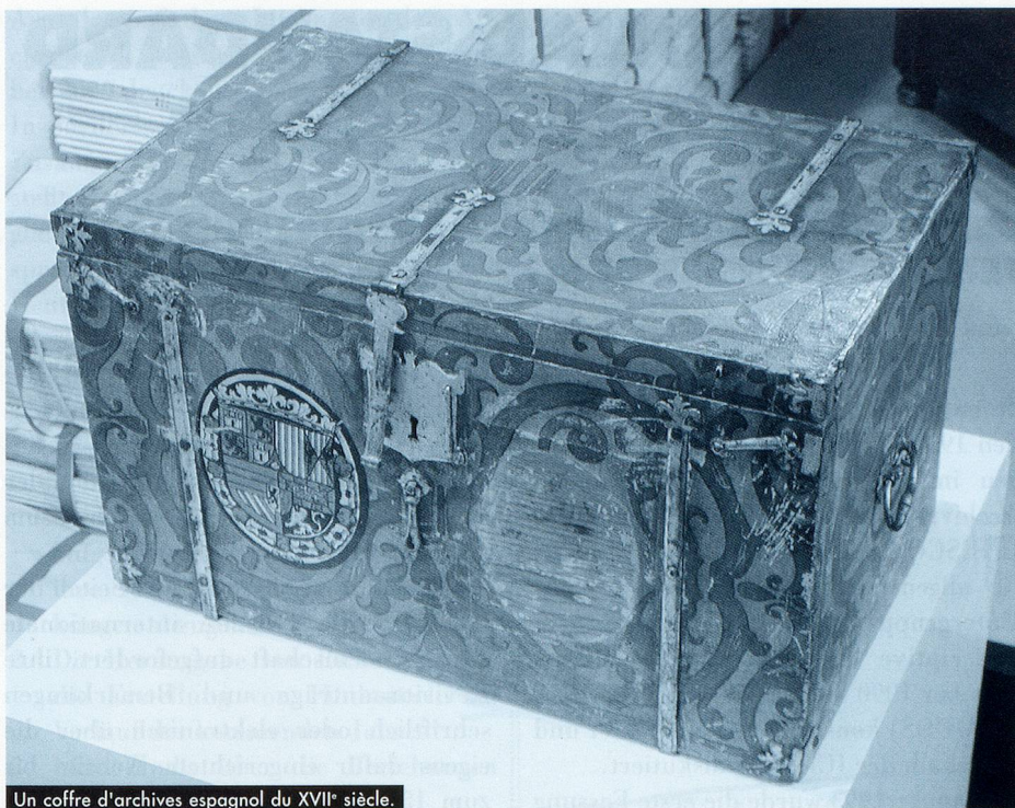
Un coffre d'archives espagnol du XVII e siècle.

nisations internationales non gouvernementales chaque fois qu'il convient, ce comité entreprend des études et des recherches sur les sceaux de façon à en approfondir les connaissances, élaborer des normes pour leur description et des guides pour leur préservation, leur conservation et leur restauration, et en ces domaines promouvoir les échanges de vue et d'expérience.