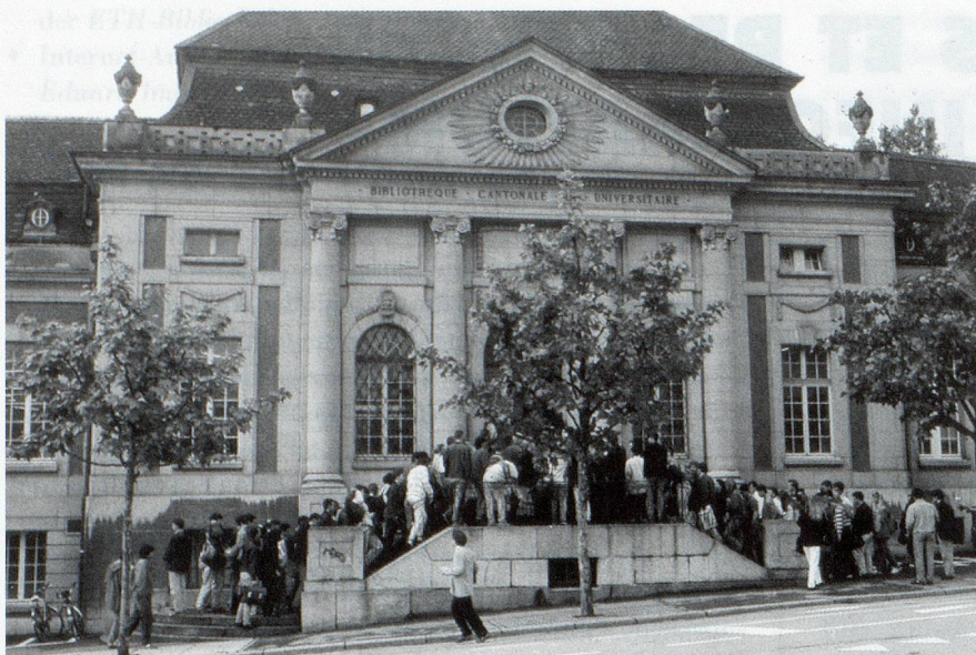
La bibliothèque reste le lieu privilégié pour l'accès démocratique à l'information (La BCU de Fribourg)