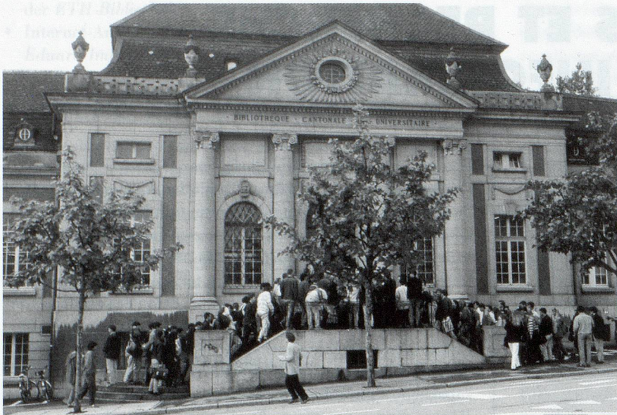
La bibliothèque reste le lieu privilégié pour l'accès démocratique à l'information (La BCU de Fribourg. Photo de Alex E. Pflingstag)