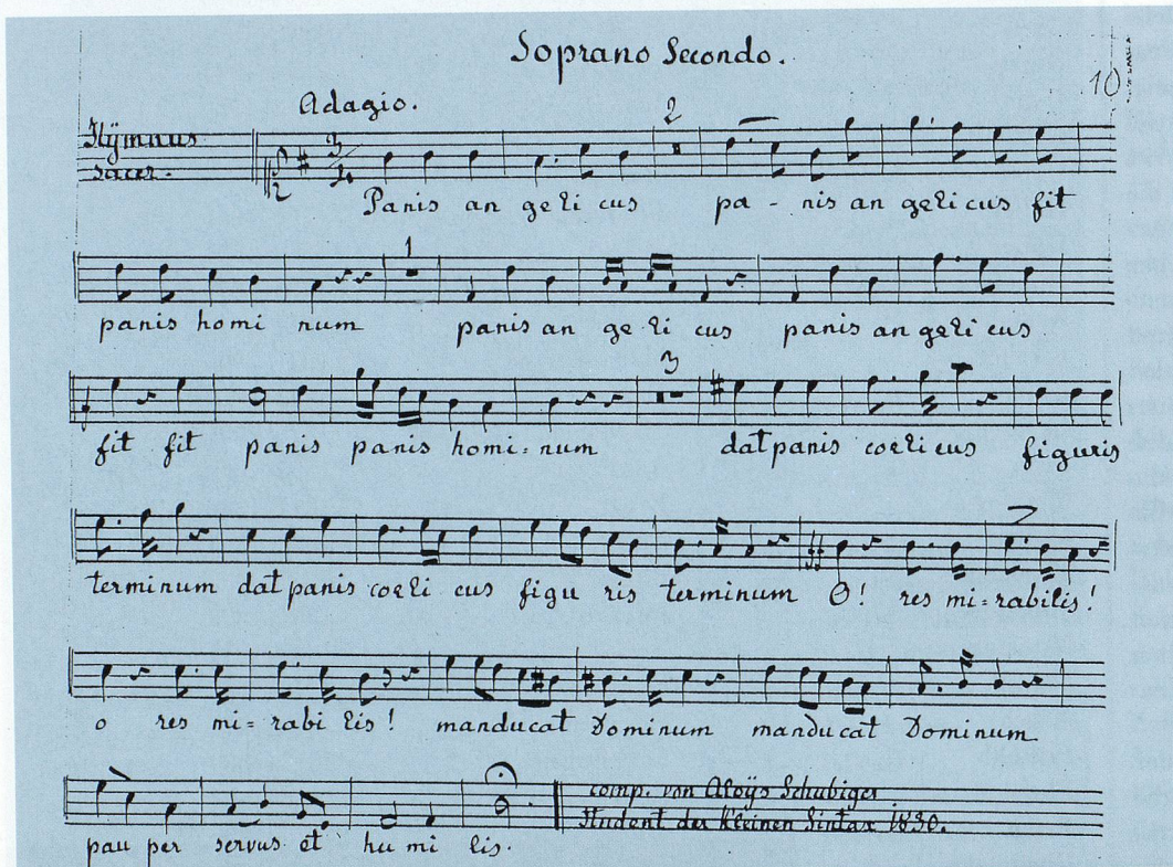
Anselm Schubiger (1815–1888) Hymnus Sacer «Panis Angelicus» Autograph der zweiten Sopranstimme, 1830. Bereits als Einsiedler Gymnasiast Alois Schubiger komponierte der spätere Pater Anselm Musik für den liturgischen Gebrauch seiner späteren Wirkungsstätte.

welche die erhaltenen Manuskripte und Drucke als schützenswerte Kulturgüter dokumentiert, und durch die zur Verfügung stehenden EDV-Programme wird über die Erfassung des Œuvres einzelner Komponistinnen und Komponisten hinaus eine differenzierte Recherche nach den verschiedensten Suchkriterien (Gattung, Besetzung, einzelne Teile eines Werks wie Arien oder Sätze, Text- und musikalisches Incipit und vieles mehr) ermöglicht. Angesichts der Fülle musikalischer Aktivitäten in der Schweiz des 19. Jahrhunderts ist eine Erfassung sämtlicher Kom-