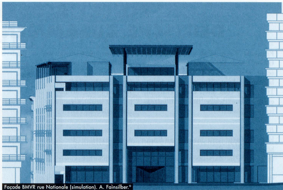
Façade BMVR rue Nationale (simulation). A. Fainsilber.®

La façade Rue du Petit Saint Jean abrite le passage piéton couvert. Elle présente une succession de volumes de 8 mètres de large qui correspond sensiblement à la