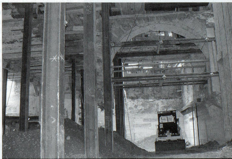
Realisierung einer Vision: Grossflächige Unterkellerung der Altstadtliegenschaften «Tösserhaus» und «Blumengarten». In diesen Altstadtliegenschaften, die teilweise bis ins 12. Jahrhundert zurückreichen, entsteht in enger Zusammenarbeit mit der Denkmalpflege die neue, achtstöckige Stadtbibliothek Winterthur. Dank Selbstverbuchung und Rückgabebautomaten wird sich das Personal voll der KundInnenberatung widmen können.