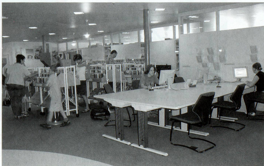
Freundliche Atmosphäre an Uris «unausschöpfbaren Brunnen».

Budgetvorgaben und Personalbestand ermöglichen lediglich segmentweises aber kontinuierliches Agieren im Bereich Bestandespflege. Eine Optimierung der Öff-