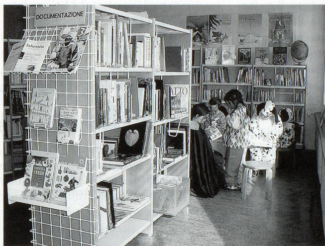
I giovani utenti di Bibliomedia a Biasca.

Fra le biblioteche di pubblica lettura circa il 60% fa capo ai comuni, il 23% al cantone e il 17% ad istituzioni private; molti istituti comunali gestiscono fondi particolarmente indirizzati ai giovani. La maggior parte di queste biblioteche, come detto, è sorta con il sostegno di Bibliomedia Svizzera, che mette a disposizione tutta una serie di servizi atti a ridurre in modo notevole i possibili problemi di gestione.