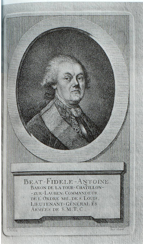
Beat Fidel Zurlauben, 1720–1799.

Bücher stammen aus bekannten und berühmten Druckereien aus ganz Europa. Aus dem heutigen Kanton Aargau sind die Druckorte Baden, Brugg, Muri und Wettingen zu erwähnen.