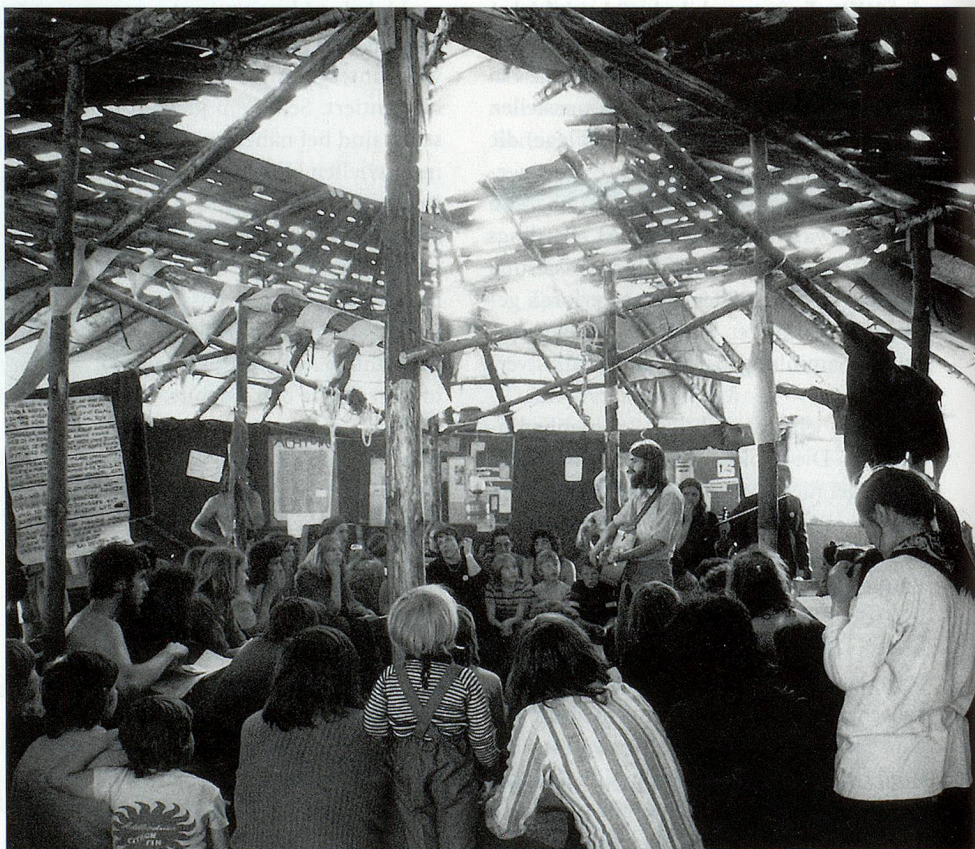
Rundbau als Versammlungsort auf dem besetzten Gelände des geplanten AKW Kaiseraugst, 1977.