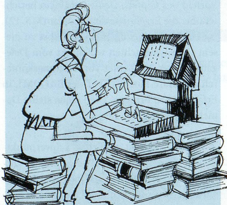
Zeichnung: Emil Leutenegger