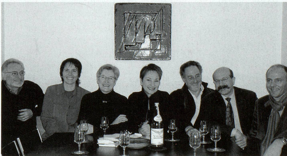
Abschluss-Sitzung des Organisationskomitees.

Während der vielen Monate der Planung und Vorbereitung und der intensiven Tage in Bellinzona kam all das zum Tragen, was mir als Generalsekretärin des BBS besonders wichtig war: