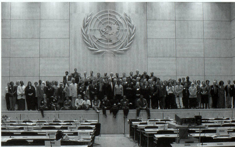
3.-4. novembre 2003: Pré-Sommet IFLA/WSIS – Les bibliothécaires à l'ONU, Genève.

Arbido -Titelbild bewundert werden kann. Das Buch «EINFACH» (ISBN 3-7296-0667-0) ist im Zytglogge Verlag (Bern/Oberhofen) erschienen, umfasst 76 zum grossen Teil auch farbig bedruckte Seiten mit köstlichem Inhalt und in kostbarer Ausstattung und wird hier mit schmetterlingshaft voreiligen Frühlinggrüssen herzlich empfohlen von dlb . Contact: www.pfuschi-cartoon.ch