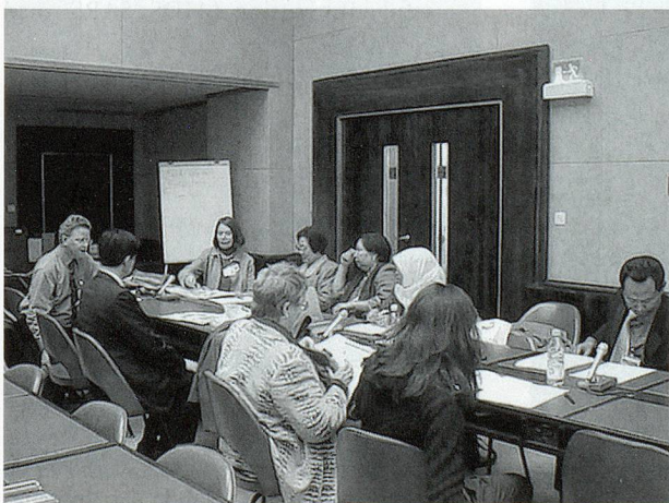
table ronde réunissant les délégués des pays de l'Asie centrale. Ce groupe étant relativement petit (7 délégués, 2 observateurs, 2 modérateurs), il a été possible de travailler à un niveau concret, analysant les points forts et les points faibles de chaque pays afin de dégager les voies communes et de définir pour chaque pays des actions réalisables dans le cadre de la Société de l'Information.