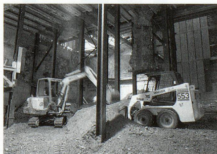
Raum für Konzepte.

Das Bibliotheksprodukt im Speziellen ist nicht einfach nur Medienausleihe, sondern wesentlich komplexer. Innere Stim-