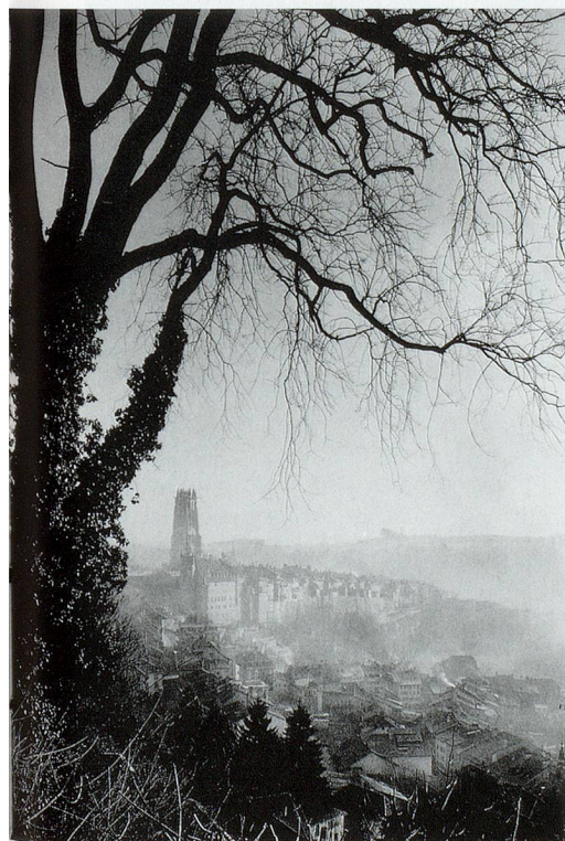
Die Freiburger Altstadt.

Wenn auch die wissenschaftliche Bearbeitung, Betreuung und Erhaltung mittelalterlicher und neuzeitlicher Codices anscheinend zu den attraktivsten Tätigkeiten einer Handschriftensammlung gehört, so ist ihr Alltag heute stark dem Sammlungsbereich von Nachlässen gewidmet.