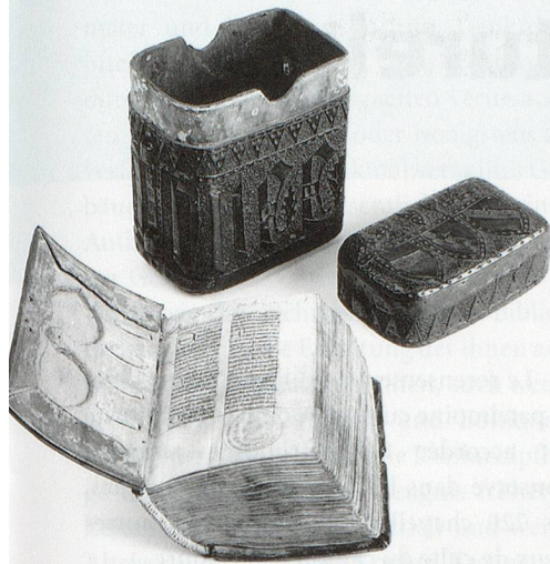
Ein mittelalterliches Brevier und sein Futtermal.