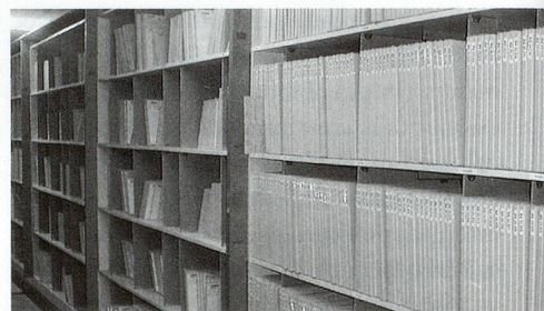
Fonds des «Patois romands et des régions frontalières» dans les Archives de la RSR. Institutions responsables: SRG SSR idée suisse/RSR; Médiathèque Valais, Martigny.

Il faut aussi comprendre ce projet comme la première étape à un accès plus