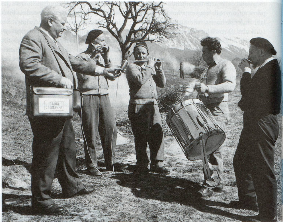
Enregistrement des fifres et tambours d'Anniviers, Sierre.

La phase de test est maintenant terminée. Un échantillon représentatif a été traité. Il est accessible sur le catalogue RERO.