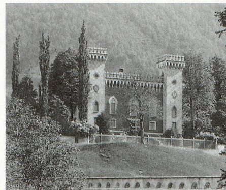
Palazzo Castelmur in Stampa-Coltura, sede dell'Archivio storico di Bregaglia.

L'archivio comprende un'esposizione permanente di documenti, fotografie e og-