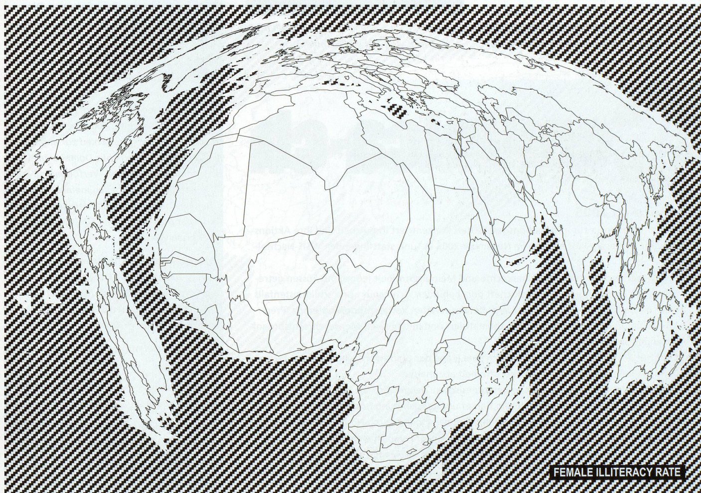
Female illiteracy rate. Global Monitoring Report, 2003, Unesco. -> http://www.efareport.unesco.org/

Neben den von Lawrence Lessing entwickelten CC-Lizenzen gibt es inzwischen eine breite Palette unterschiedlicher Lizenzierungssysteme wie die GPL ( GNU Gene-