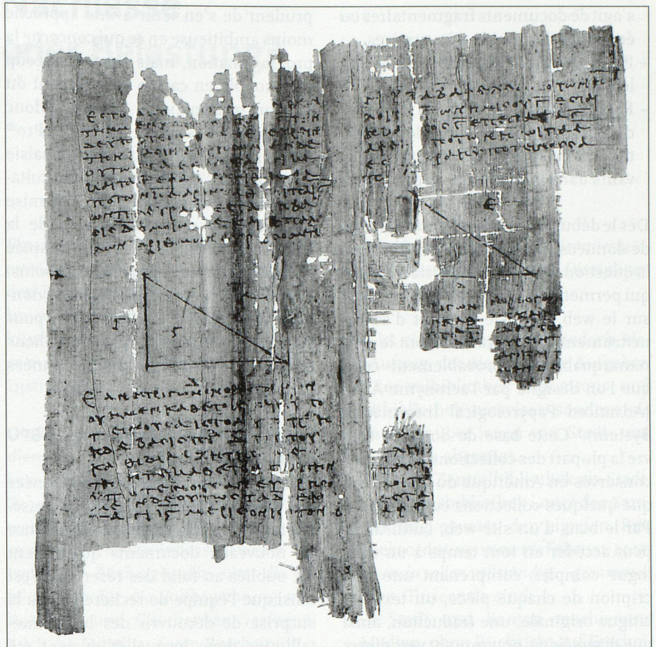
P.Gen. inv. gobis recto: Prédications astrologiques par un prophète païen (IIe siècle ap. J.-C.).

Dès sa mise en chantier, le projet reposait sur une base de données électro-