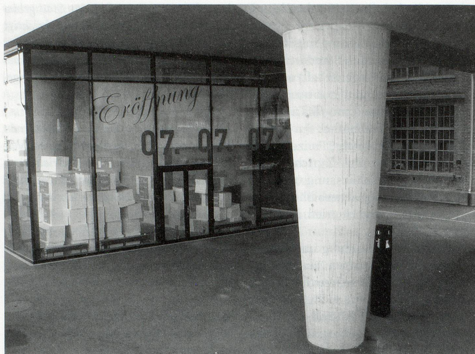
Kurz vor der Eröffnung: Bibliothek in Sihlcity

Der Entscheid der PBZ ist jedoch konsequent und deshalb endgültig.