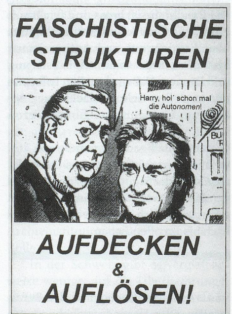
Flugblatt aus der schweizerischen Autonomiebewegung, undat., um 2000. Faschistische Strukturen – Aufdecken & Auflösen – Harry, hol' schon mal die Autonomen

Die «Frontstellung» zwischen Bewegungsarchiven und staatlichen Archiven, die sich aus der Entstehungszeit und den Gründungsgedanken der Bewegungsarchive herleiten lässt, erscheint heute anachronistisch. Mit der vernetzten Überlieferungsbildung kann gar nicht früh genug begonnen werden. Die Möglichkeiten der Zusammenarbeit sind zahlreich. Sie reichen vom gegenseitigen Erfahrungsaustausch, über den Tausch von Dubletten