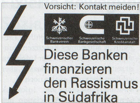
Plakat aus der Antipartheid-Bewegung der Schweiz, undat. Um 1985. Vorsicht: Kontakt meiden! Diese Banken finanzieren den Rassismus in Südafrika