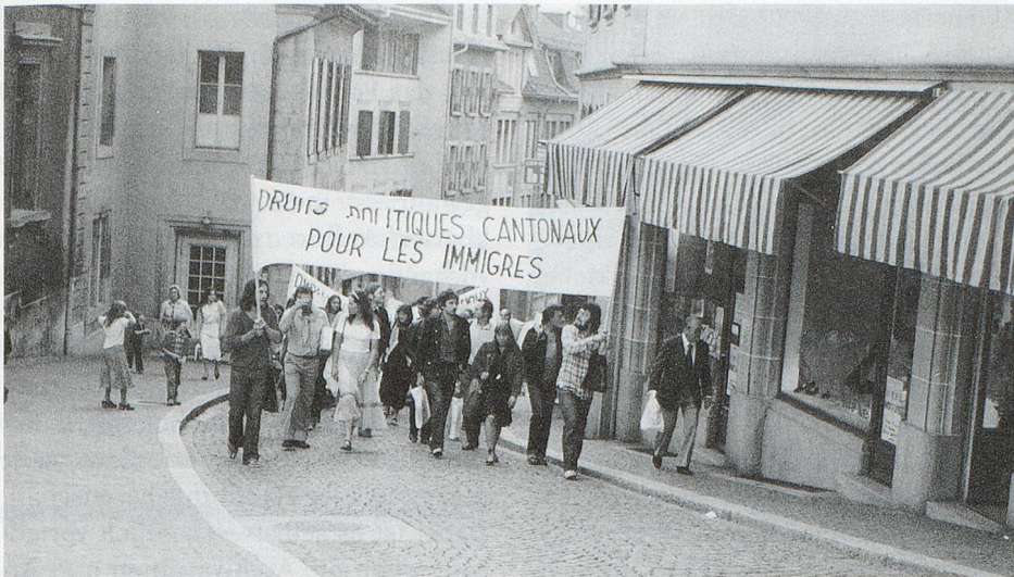
Fotografie, Demonstration in Lausanne, undat., um 1975. Droits politiques cantonaux pour les immigrés (Lausanne).

naler Ausstrahlung, beispielsweise aus dem Kontext der Frauenbewegung, der Arbeiterbewegung oder des Anarchismus.