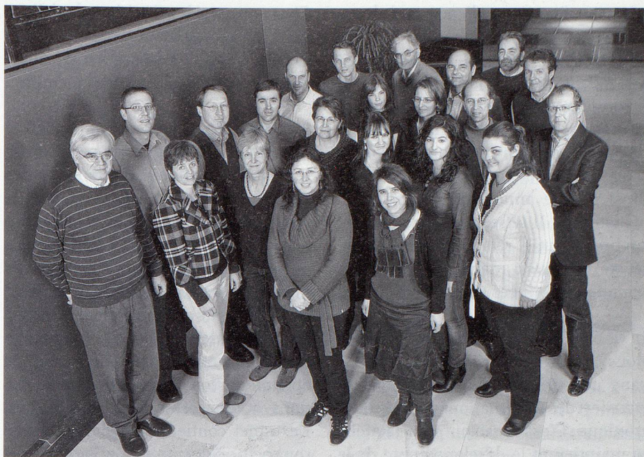
Les collaboratrices et collaborateurs du Service de documentation.

Le secrétariat élabore avant chaque session de chaque chambre un aperçu des matières qui y seront traitées. Cet aperçu contient en résumé les informations importantes relatives à chaque objet. Il est également disponible sur internet et constitue un important ins-