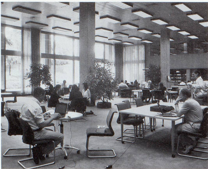
Vue de la salle de lecture I.