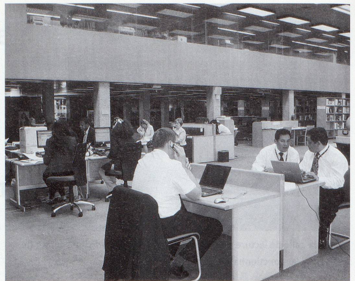
Vue de la salle de lecture II.

information sur les normes de sécurité et les dangers chimiques et physiques. La quatrième édition de l'Encyclopédie sur la santé et la sécurité au travail est disponible gratuitement en ligne, ainsi qu'en version imprimée (quatre volumes) et sur CD-ROM (versions française et espagnole également disponibles). - l'Association internationale de la sécurité sociale (AISS) www.issa.int et son centre de documentation. L'AISS est responsable de la base de données «Sécurité sociale dans le monde (SSW)» (sur CDROM) contenant le