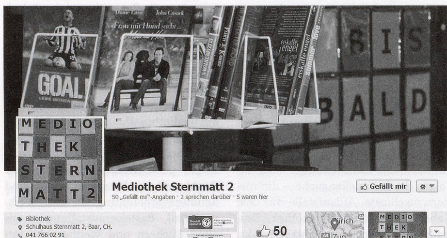
Die Jugendlichen abholen, wo sie sich aufhalten – z.B. im Facebook.

Trotz allen Bemühungen gibt es auch in Baar leseschwache Jugendliche, die kaum freiwillig wegen des tol-