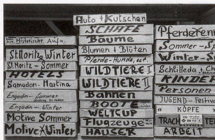
Viel Arbeit: fotografischer Nachlass in Bearbeitung.

Einmalig ist die Recherche in der Bilddatenbank, die online zugänglich ist. Sie umfasst rund 13000 Bilder, die systematisch erfasst und erschlossen sind. Die Bilder sind eine ausserordentlich reiche Quelle für unterschiedlichste Forschungs- und Publikationszwecke. In Zusammenarbeit mit dem Institut für Medienwissenschaften der Universität Basel wird die Datei momentan überarbeitet und die Funktionalität verbessert.