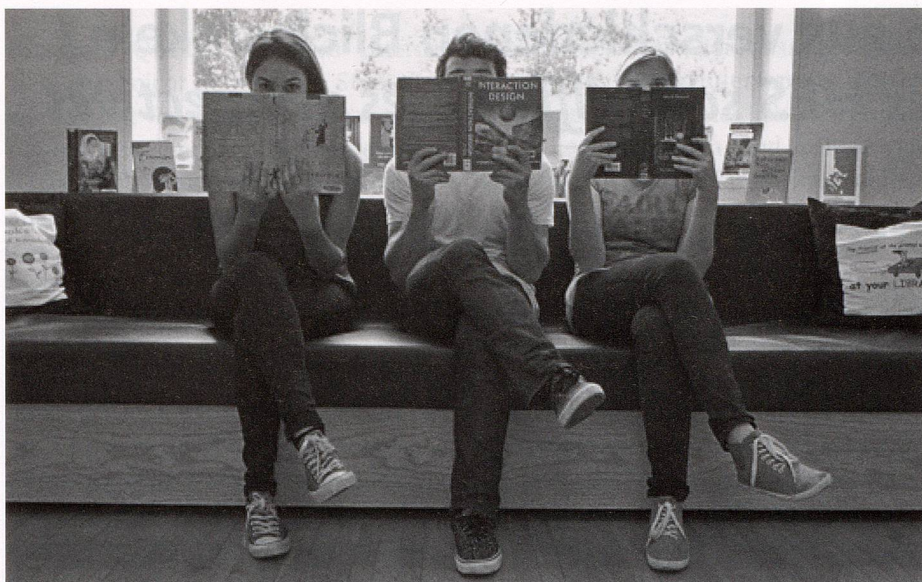
Abbildung 1: Fotowettbewerb «Mein liebster Leseort».

Die Initianten dieses Projektes bieten ein ständiges Weiterbildungsprogramm an in Form von Vorträgen und Workshops zu bibliotheksspezifischen Themen.