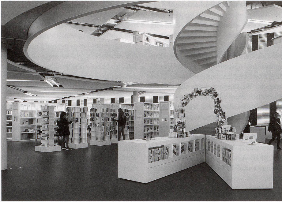
Drei Stockwerke, 100 000 Medien und viel freie Fläche: Die Campusbibliothek der Fachhochschule Nordwestschweiz in Brugg.