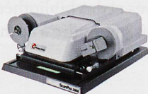
Mikrofilmscanner für alle Mikrofilmarten