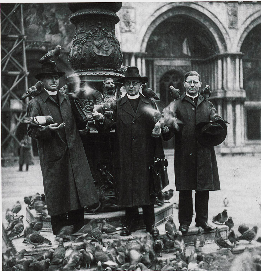
Bei der Ausreise nach Südrhodesien im Jahr 1939 machen drei Immenseer Missionare Zwischenhalt in Venedig, bevor die Reise mit dem Schiff weitergeht.

Die im Archiv aufbewahrten Unterlagen legen Zeugnis ab vom vielfältigen weltweiten Wirken der Immenseer Missionare, deren missionarische Tätigkeit sehr weit gefasst werden muss. So sind denn die Archivalien auch nicht nur für kirchlich Interessierte von Bedeutung. Anhand der Akten, Fotos und Filme lassen sich bedeutende Leistungen der Immenseer Missionare erforschen, sei dies nun moderne Kirchenarchitektur in Japan und Taiwan, medizinische Ethik, indigene Sprachen und Übersetzungen, japanisches Theater, taiwanische Musik, afrikanische Instrumente und anderes mehr. Die Immenseer Missionare gründeten eine afrikanische Schnitzerschule, bauten Staudämme, errichteten Lehrlingswerkstätten und führten eine Druckerei. Sie erlebten den Befreiungskrieg in Simbabwe hautnah, verloren Mitbrüder und blieben auch in höchster