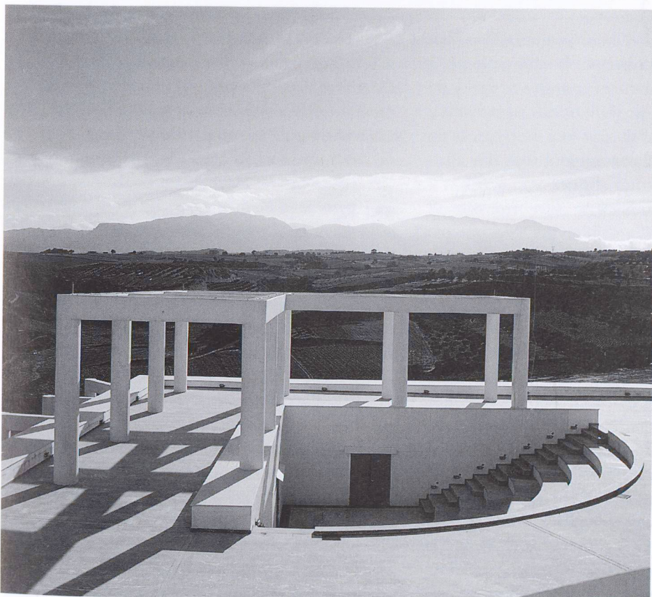
2 — Casa per Zeus

When I assign an exercise like, for example, the Invisible Cities of Italo Calvino, it is clear that the purpose is not to build them in any real sense. The point is not to build a real city. This way of thinking is connected with personal research. The purpose of the development of themes that stimulate me, even if they are imaginary themes, is not only the representation of a truth, but it is truth in itself. The architect must cultivate this spiritual dimension in his life, he must introduce his dreams into his work. This way of thinking is existential, it is not moralistic. I am speaking of a necessity, of spiritual survival and not of material survival even if the problem of material contingencies remains. But if an architect does not create anything and neglects his spiritual life, there is an imbalance that renders his activity sterile in the world of matter.