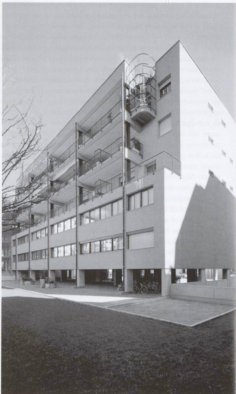
Enrico Mantero, edificio per abitazioni e uffici a Como, 1985

Mantero però non ha solo scritto, è stato anche architetto nel senso stretto della parola. Sia come insegnante al Politecnico di Milano (di cui è stato Direttore del Dipartimento di Progettazione dal 1982 al 1985), sia come progettista. E sono proprio le opere da lui realizzate a confermare quanto importante possa essere, nell'esplicitare la professione, il coniugare la preparazione teorica con la conoscenza del mestiere. Perché di progetto in progetto, di architettura in architettura, Mantero ha sempre lavorato dentro i binari di una disciplina progettuale che, al di là delle singole invenzioni formali o suggestioni dettate dal luogo, lo ha portato a perseguire sempre lo stesso ideale progettuale. È qui che risiede il valore della sua architettura: nel «corpus» complessivo. Tra l'albergo progettato in gioventù (1960) assieme al padre Gianni, ingegnere, la casa di riposo a Rebbio (1980), l'edificio per abitazioni e uffici in via Borsieri a Como (1985) – forse la sua opera migliore – e gli interventi nello Stadio di calcio Sinigaglia, sempre a Como (dal 1989), corre un'unica sottile linea, fatta di coerenza, espressione di una ricerca perseguita durante tutta la vita.