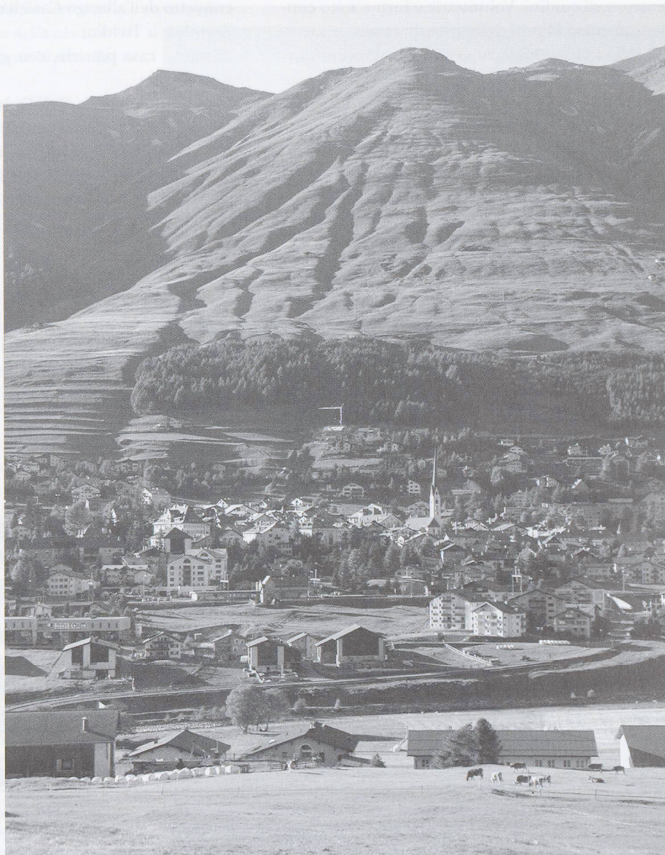
1 – Celerina, 1797 2 – St. Moritz, 1908 3 – Zuoz, 2003

Palazzine d'appartamenti circondano i villaggi, producendo la «periferia alpina»: i campi di grano terrazzati vengono occupati da case, da strade,