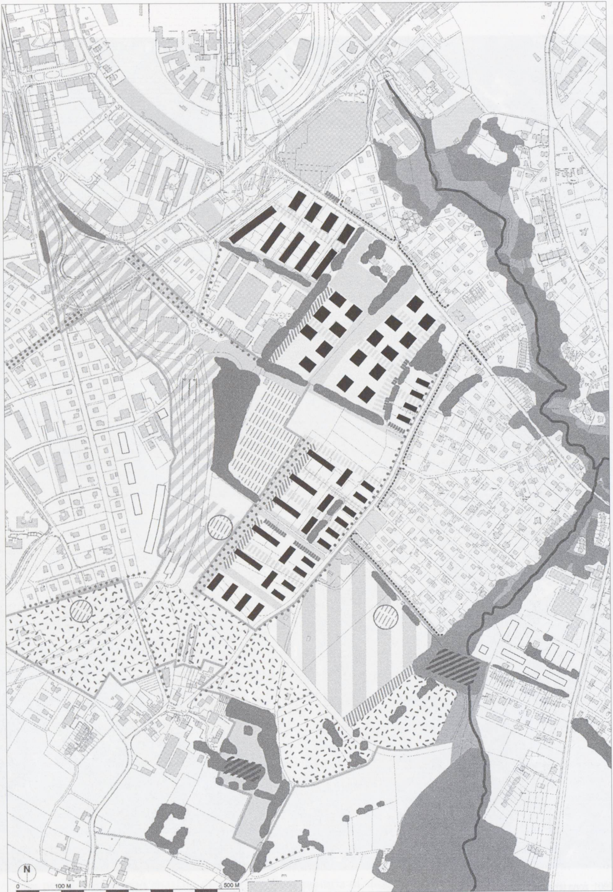
Périmètre d'aménagement coordonné (PAC) per «Un nouveau quartier La Chapelle-Les Sciers», DAEL, Direction de l'aménagement du territoire. Piano del verde e dell'inserimento delle edificazioni Architetti e urbanisti: DeLaMa, Fischer & Montavon