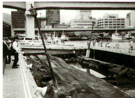
Terremoto di Kobe, 1995