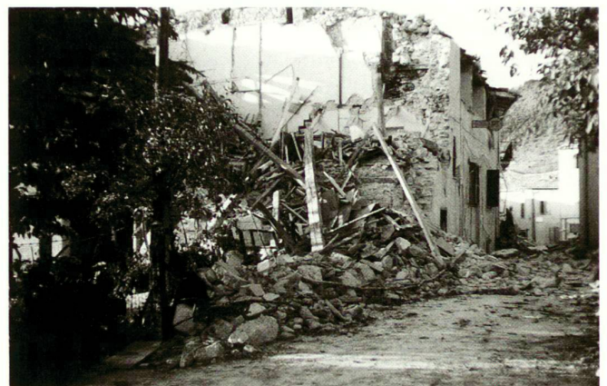
Terremoto in Irpinia, 1980