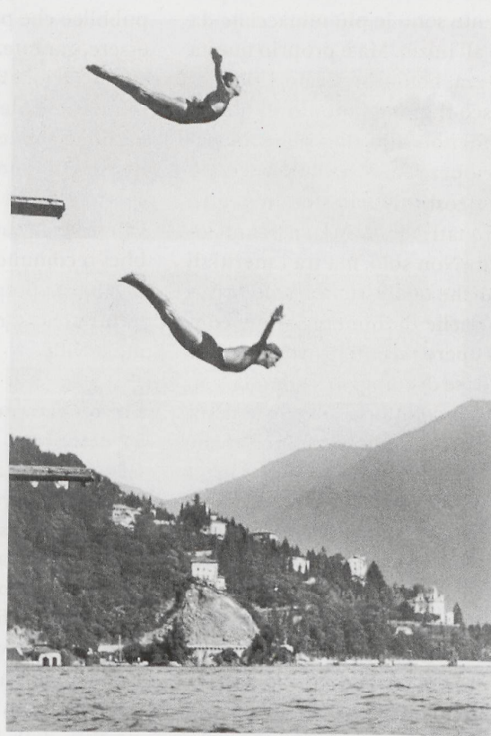
Lugano-Lido verso Castagnola (Lugano, s.d)