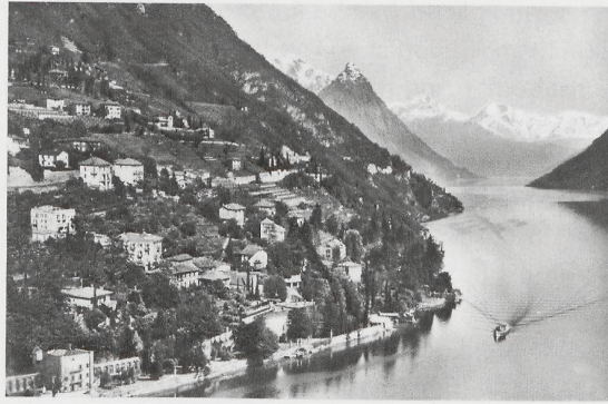
Il ramo occidentale del Ceresio (Berna, s.d)