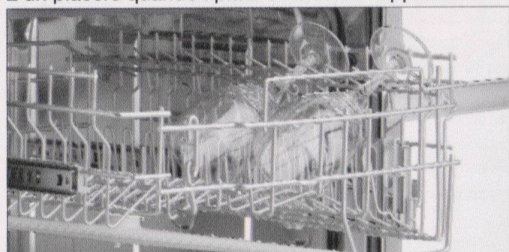
Comodo utilizzo del cestello superiore.

È un piacere quando i piatti e i bicchieri appaiono nella giusta luce: le comode lavastoviglie Electrolux lo rendono possibile.