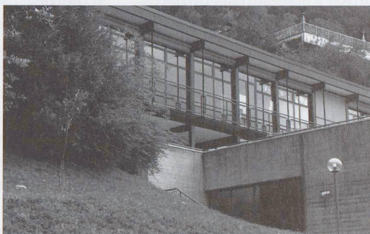
Fig. 3 – Dolf Schnebli, Scuola Media a Locarno, 1960