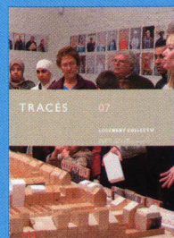
Tracés n.07 Logement collectif www.revue-traces.ch