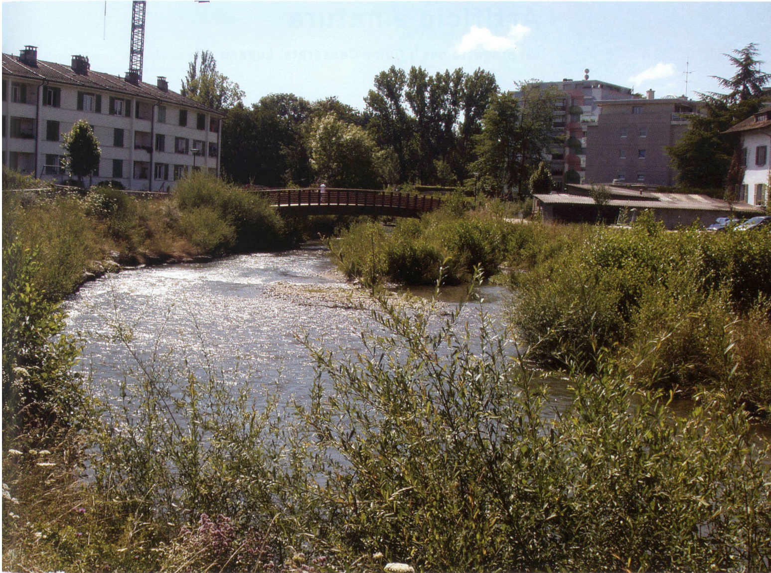
Sezione A-A sull'ansa del fiume, in cui appare l'allargamento dell'alveo che ha permesso la formazione di una penisola, parte della più ampia area naturalistica, delimitata dal percorso pedonale. ➔