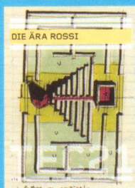
Tec21 n. 25 Die Ära Rossi www.tec21.ch