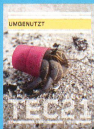
Tec21 n. 31-32 Umgenuzt www.tec21.ch