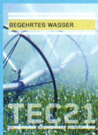
Tec21 n.41 Begehrtes wasser www.tec21.ch