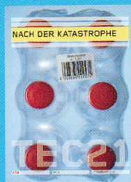
Tec21 n.8 NACH DER KATASTROPHE www.tec21.ch