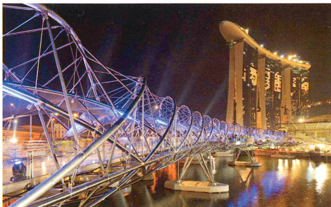
The Helix, Singapore