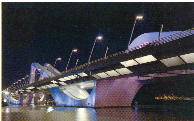
Sheikh Zayed Bridge, Abu Dhabi

Anche in questo caso, l'illuminazione tende ad enfatizzare l'andamento geometrico della struttura, utilizzando LED dinamici multicolore che possono cambiare in base al tipo di evento.