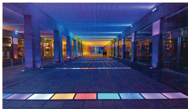
Pont Brabant; Saint Josse