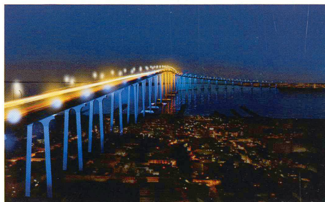
San Diego Coronado Bridge; California