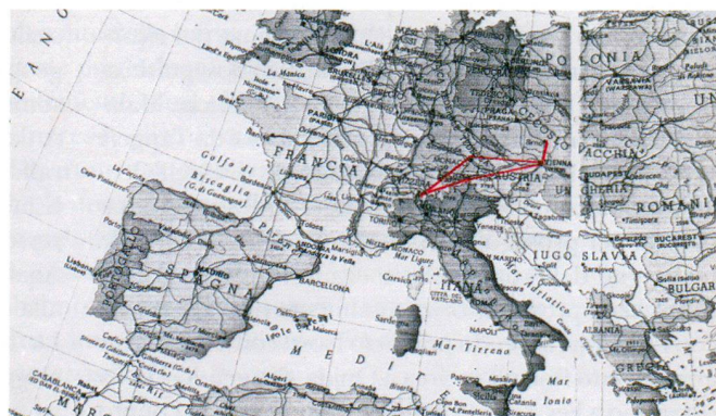
Viaggio di studio, Barocco, 1966. (Fondazione AAT)