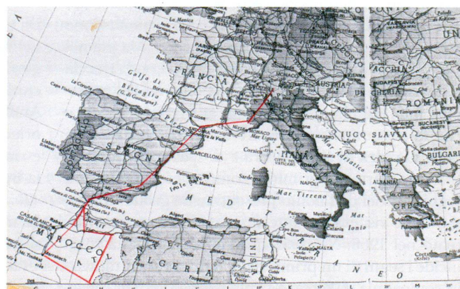
Viaggio di studio in Marocco, 1958. (Fondazione AAT)