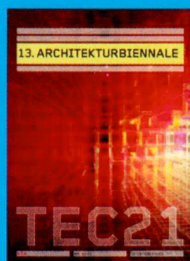
Tec21 n. 13 ARCHITEKTURBIENNALE www.tec21.ch