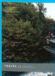
Tracés n. 22 TABLIER COMPOSITE www.revue-traces.ch