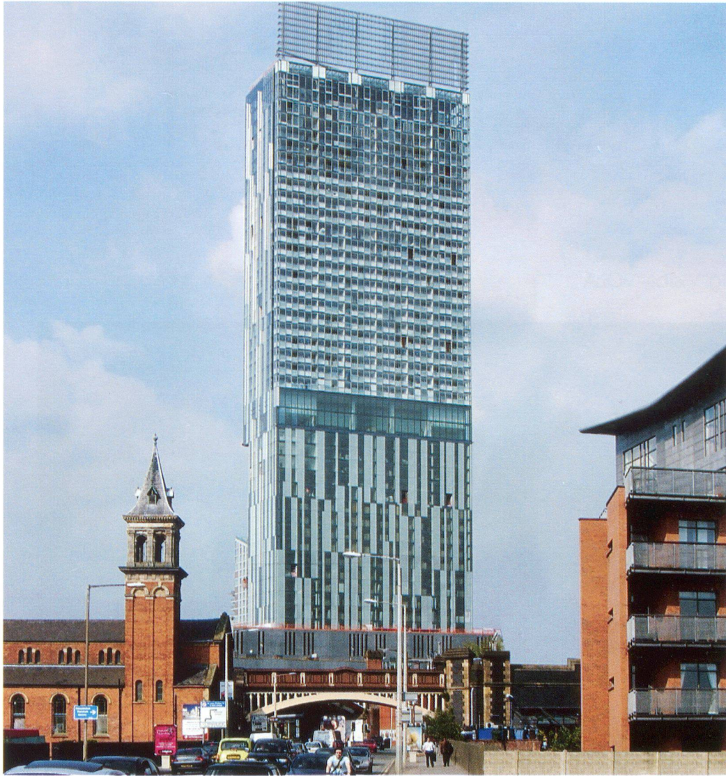
Beetham Tower, Manchester